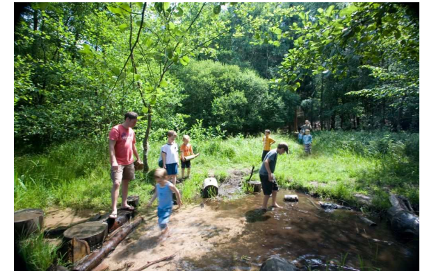
Der Bach ist nur 100 Meter weg.